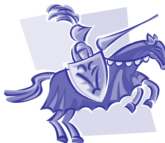
Une charge destructrice....

une déréglementation totale de tous les textes qui l'obligent aujourd'hui encore à respecter un minimum les droits des salariés et à assumer une part des dégâts sociaux provoqués par sa course inconsidérée au profit.